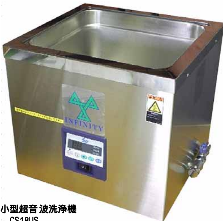
加温式小型超音波洗浄機 CS18US